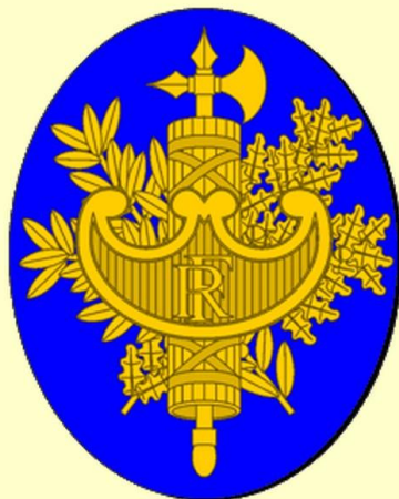
République Française Armes semi-officielles

Le faisceau est recouvert d'un bouclier sur lequel sont gravées les initiales R.F. (République française). Des branches de chêne et d'olivier entourent le motif. Le chêne symbolise la justice, l'olivier la paix.